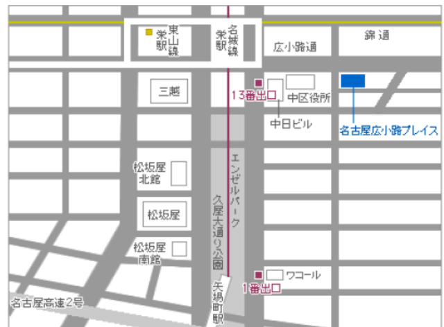
地下鉄東山線・名城線「栄」駅 13番出口より徒歩2分（中区役所並び）

ソフトウェア技術者でハードウェアの実習を通して電子回路を習得されたい方を対象に、製作実習、計測実習、講義を行います。