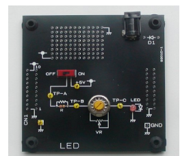
教材 LED 基板